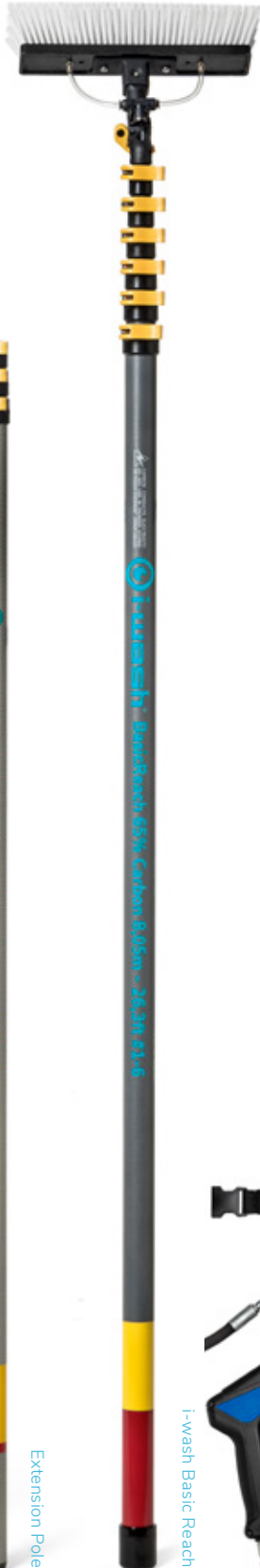
i-wash Basic Reach