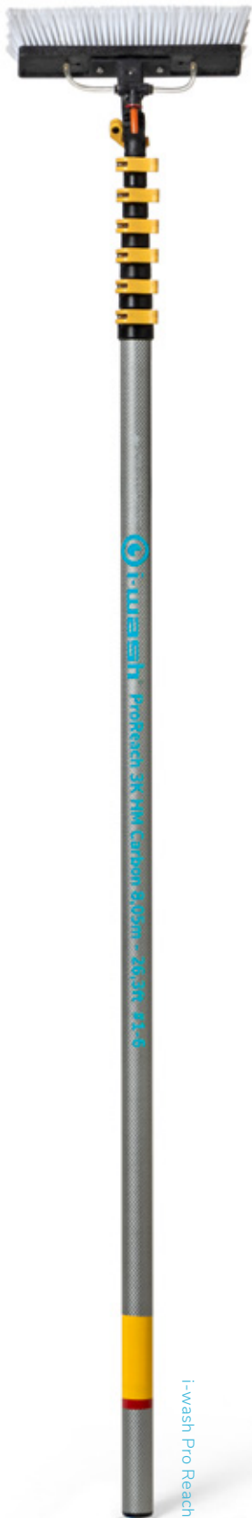
i-wash Pro Reach

Pesuvarren jäykkyys ja paino vaikuttavat työtehoon. i-wash-sarjassa on kolme erilaista vettä johtavaa pesuvartta ja kaksi pidennysvarrtta. Voit valita aina tilanteeseen sopivan varren tehtävän, työajan ja työskentelykorkeuden mukaan.